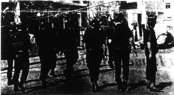
La G.R.P., el pasado 11 de octubre arremetió contra los prisioneros de guerra y presos políticos del penal de Socabaya-Arequipa.